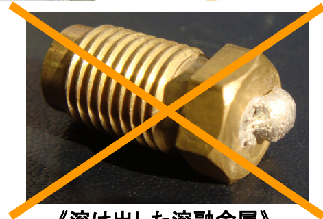
《溶け出した溶融金属》